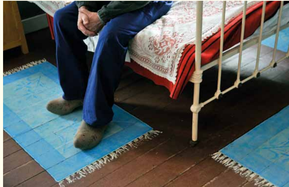
Museum van de Mijnwerkerswoning in Eisden.

Gedeeltelijk toegankelijk voor mindervaliden.