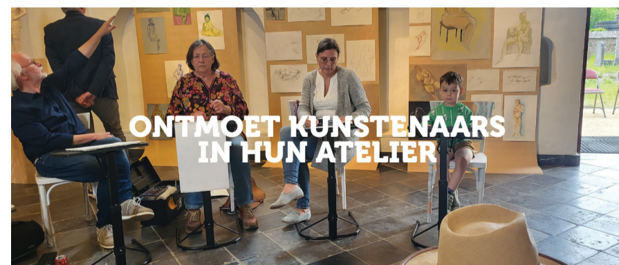
ONTMOET KUNSTENAARS IN HUN ATELIER