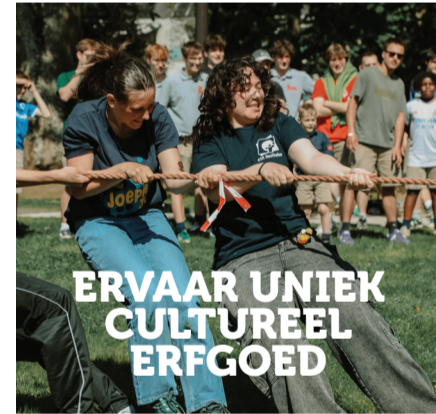
ERVAAR UNIEK CULTUREEL ERFGOED