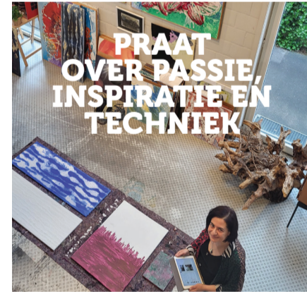
PRAAT OVER PASSIE, INSPIRATIE EN TECHNIEK