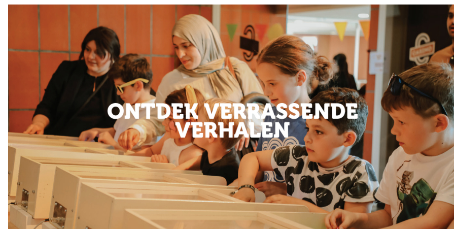
ONTDEK VERRASSENDE VERHALEN