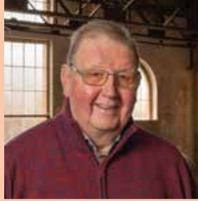
Swa Hemelaers Citévolk Spreek

In mei 2022 werd ECRU Erfgoed officieel boven de doopvont gehouden. Sinds die dag spreken we niet langer van Erfgoedcel Mijn-Erfgoed, maar bundelen we samen met ECRU Cultuur de krachten onder het merk ECRU. Met ondersteuning van de Vlaamse Overheid en de gemeenten As, Beringen, Genk, Heusden-Zolder, Houthalen-Helchteren, Leopoldsburg en Maasmechelen wakkeren we de cultuur- en erfgoedspankel aan in onze regio. ECRU Erfgoed staat voor de verderzetting van onze werking zoals deze al meer dan vijftien jaar bestaat, maar welke diensten biedt ECRU dan allemaal precies aan? Deze getuigenissen bieden alvast een mooi antwoord op die vraag.