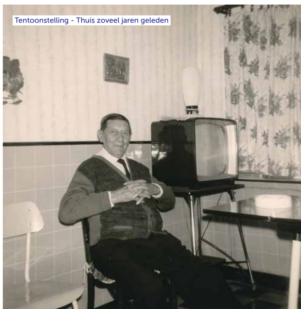
Tentoonstelling - Thuis zoveel jaren geleden